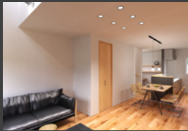
※パースは全てイメージです。