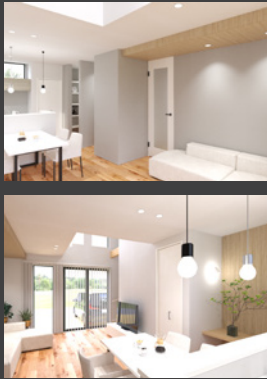
※パースは全てイメージです。

販売価格 3,690万円 (外構・税込) ※上下水道負担金770,000円(税込)別途