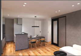
※パースは全てイメージです。