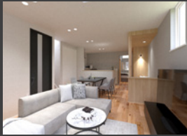
※パースは全てイメージです。