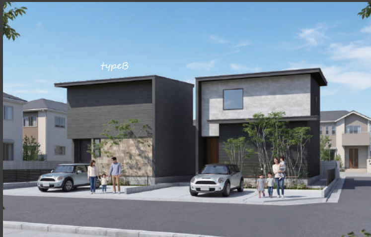
※外構や植栽などは全てイメージです。実際とは異なります。