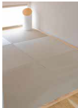
多目的に使える畳コーナー