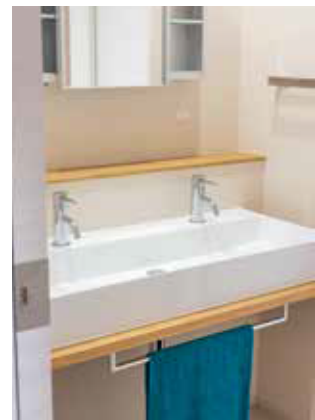
ふたり同時に使える大きな洗面