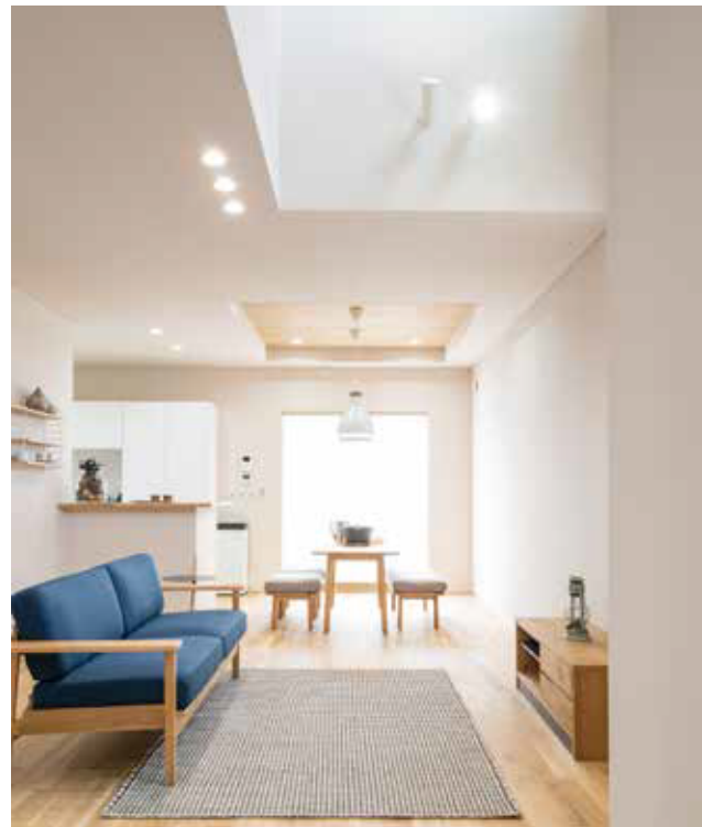
一つの空間として大きく自由に使えるリビング・ダイニング